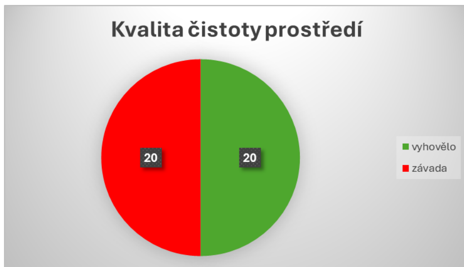
Graf č. 1: Kvalita čistoty prostředí – počet kontrolovaných zařízení

a pracovních ploch v kuchyni a výdejně a k mytí a dezinfekci zakoupily jiné prostředky, aby se zabránilo vzniku rezistence mikrobů na často používané chemické látky. Tento úkol bude pokračovat jako krajská priorita ve stejném rozsahu i v roce 2025.