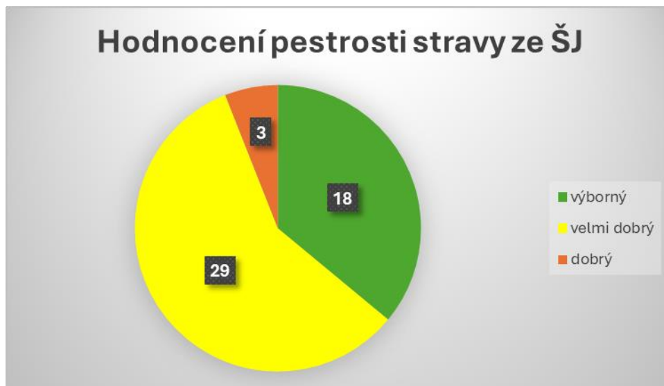
Graf č. 2: Hodnocení pestrosti stravy ve školních jídelnách (počet jídelníčků)

Tato celostátní prioritní oblast výkonu SZD byla zaměřena na zjišťování pestrosti stravy nabízené školními jídelnami dětským strávníkům. Jednotlivé jídelníčky byly hodnoceny podle nutričního doporučení Ministerstva zdravotnictví. Rozsah provedení daného úkolu nebyl centrálně stanoven, KHS PK provedla 42 takto zaměřených kontrol. Tato priorita byla splněna na 105 %, neboť počet plánovaných kontrol byl určen na 40. Zhodnoceno bylo 50 jídelníčků (ve 31 mateřských školách a v 19 školách základních). Co se týká výsledků byl výborný jídelníček sestaven v 18 školních jídelnách . Velmi dobrý jídelníček mělo 29 jídel a ve 3 případech byl zhodnocen jídelníček pouze jako dobrý . V případě samostatného hodnocení pestrosti přesnídávek a svačinek byly 4 jídelníčky sestaveny s nízkou úrovní. Mateřské školy mají problémy se zařazováním luštěninových a zeleninových pomazánek, také s je opomíjeno podávání obilných kaší a není plněna ani frekvence podávání celozrnného a vícezrnného pečiva. Při posuzování pestrosti nabídky obědů – neplní některé jídelny frekvenci zařazování zeleninových polévek, problémy jsou i s dodržováním četnosti podávání bezmasých slaných pokrmů a čerstvé zeleniny. Stále se v některých nabídkách objevují uzeniny jako párek, klobása, uzené maso, slanina.